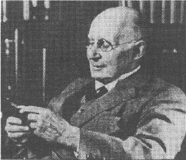
Alfred North Whitehead (1861-1947)

Hij was een beoefenaar van de wiskunde. Voordat hij verhuisde naar de Verenigde Staten hadden al zijn werken dan ook betrekking op de symbolische logica, wiskundige fysica en de filosofische implicaties van de wis- en natuurkunde. In 1942 werd hij door de Harvard-universiteit uitgenodigd de filosofische faculteit te komen versterken. In de tijd die hij daar doorbracht, publiceerde hij zeven boeken, waarin hij zijn filosofische ideeën verfijnde en uitwerkte. Hij voelde de innerlijke noodzaak de zwaai te maken naar de metafysica in een tijd waarin men hiernaar met grote argwaan keek en zelfs de mogelijkheid ervan in twijfel trok. Van zijn werken noemen wij: "The principle of reality" (1922), "Science and the modern world" (1925), "Religion in the making" (1926), "Process and reality" (1929), "The aims of education" (1929), "Adventures of ideas" (1933), "Modes of thought" (1938)