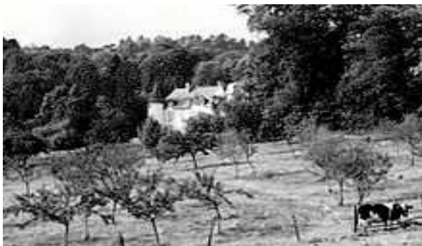
Landgoed Sarcenat rond 1890, in de tijd dat TdC daar opgroeide

De opvattingen van Teilhard over de ontwikkeling van wereld en kosmos stonden in schril contrast met het bijbels fundamentalisme en het religieus creationisme. Voor de katholieke kerk betekenden ze een bedreiging van de traditionele theologie en van het kerkelijk leergezag. De meeste geschriften van Teilhard werden door het Vatikaan afgewezen en mochten tijdens zijn leven niet worden gepubliceerd. Na de dood van Teilhard bereikten zijn werken al snel grote oplagen en werden ze in vele talen vertaald. Zijn meest bekende boek, Le Phénomène humain , Ned. Het verschijnsel mens , verscheen in 1955 (Ned. 1958) – Duits: Der Mensch im Kosmos (1959).